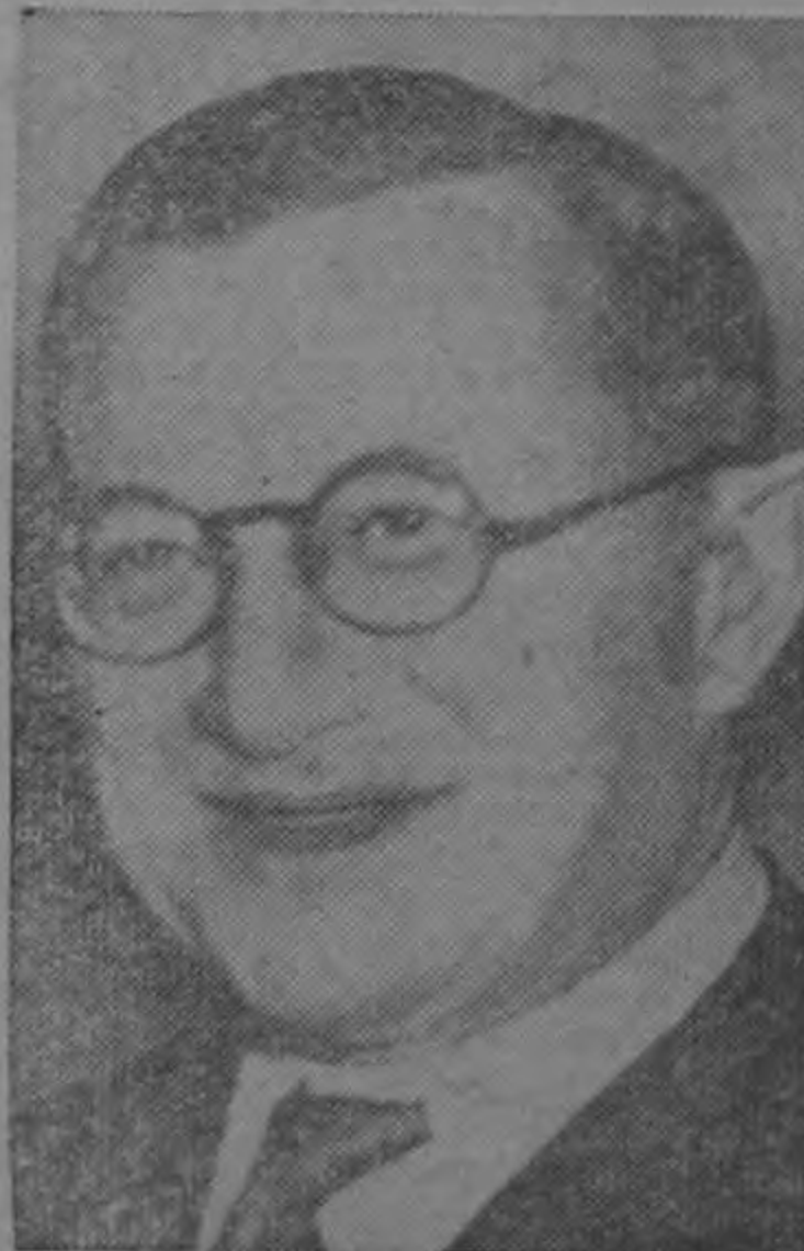
Gen. Jean de Hauteclocque